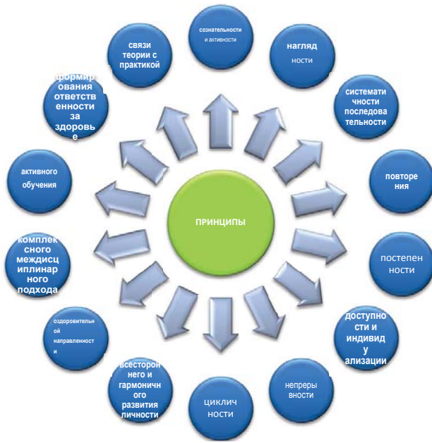
Рис. 3. Принципы здоровьесберегающей педагогики