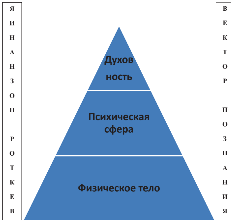
Рис. 2. Тактика познания и оздоровления, принятая в валеологии

диагностики и реабилитации является основой для создания индивидуальной программы физического оздоровления индивида (Р.М. Баевский, 1987, 2000, 2003). Это позволит количественно и качественно оценить состояние здоровья каждого человека, помочь ему выработать реальную тактику повышения своего уровня здоровья (S. Storro, I.S. Svebok, 2004).